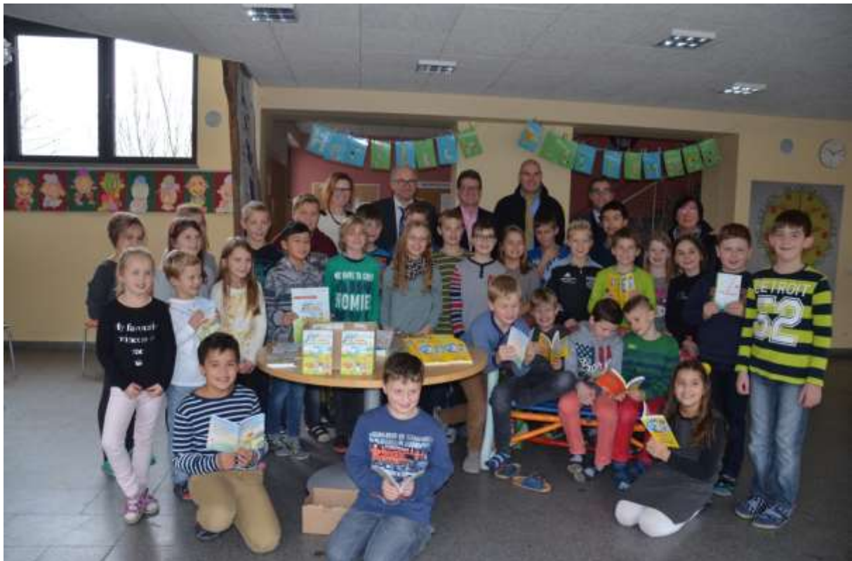
Prominente Vorleser mit Schülern der GS Aicha am 20.November 2015

Als Dankeschön für das tolle Engagement und die geschenkte Zeit schicken die Klassen in diesen Tagen „ihrem“ Vorleser ein Foto als Erinnerung mit einem kurzen Dankesbrief.