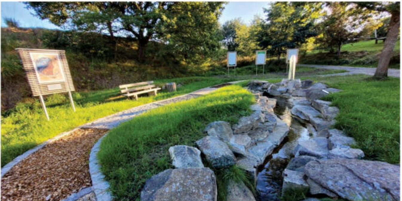
In Ruderting entstand heuer mit Hilfe des Regionalbudgets ein Barfußpfad mit Erklär-Tafeln und ökologischem Flusslauf!

ILE Passauer Oberland e.V. stellt wieder 100.000 Euro über das Regionalbudget zur Verfügung Profitieren auch Sie und Ihr Verein, Ihre Organisation oder Gruppierung davon!