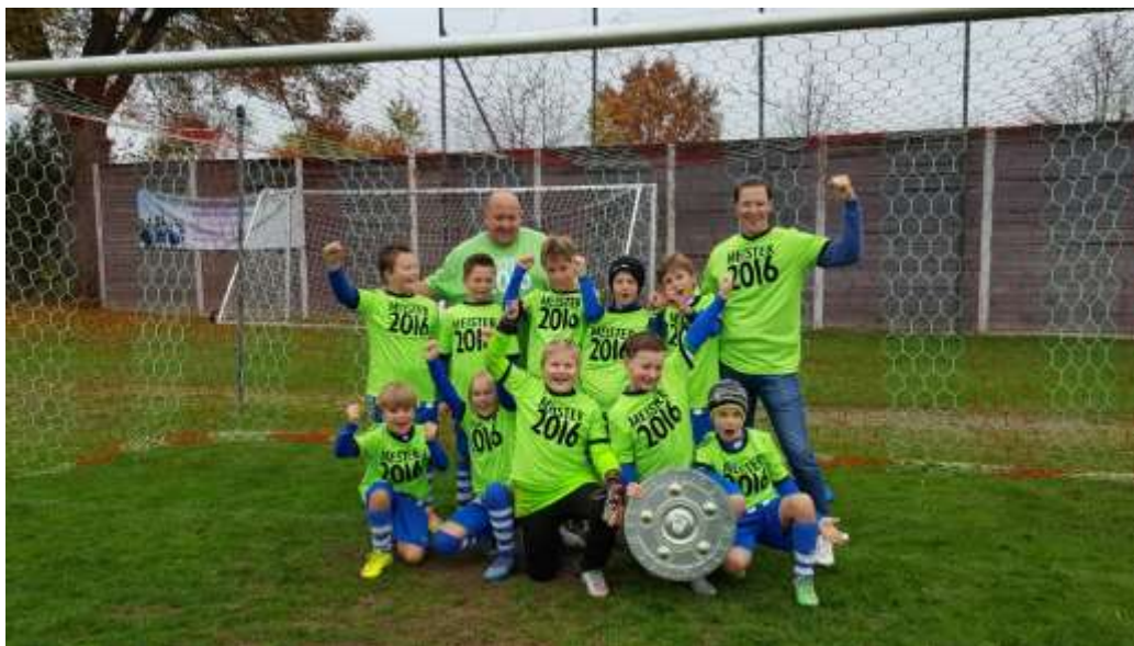
Gratulation an die E-2-Jugend zur Meisterschaft

So 06.11.16 Oberes Rottal - SV Aicha 17:00 Uhr