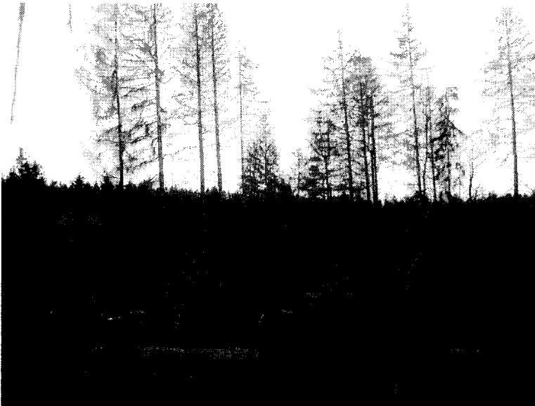
Abbildung 1 Wald mit Käferbefall aus dem September 2016