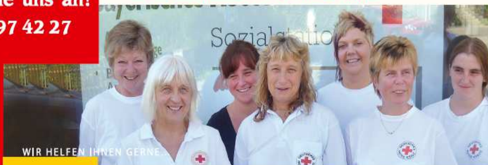
WIR HELFEN IHNEN GERNE